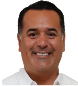
10. PAN-PRI-PANAL Renán Barrera