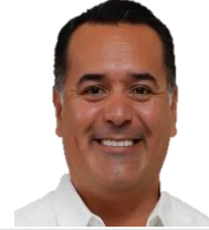
11. PRI Renán Barrera