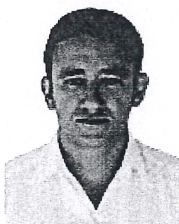
MTRO. ALBERTO RIVAS MENDOZA CONSEJERO ELECTORAL E INTEGRANTE DE LA COMISIÓN DE DENUNCIAS Y QUEJAS