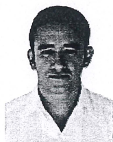
MTRO. ALBERTO RIVAS MENDOZA CONSEJERO ELECTORAL E INTEGRANTE DE LA COMISIÓN DE DENUNCIAS Y QUEJAS