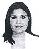
M.D.P. DELTA ALEJANDRA PACHECO PUENTE CONSEJERA ELECTORAL E INTEGRANTE DE LA COMISIÓN DE DENUNCIAS Y QUEJAS