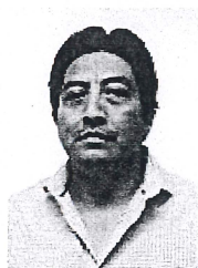
MTRO. CARLOS ALBERTO DZIB PECH CONSEJERO ELECTORAL E INTEGRANTE DE LA COMISIÓN DE DENUNCIAS Y QUEJAS