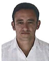
MTRO. ALBERTO RIVAS MENDOZA

CONSEJERA ELECTORAL E INTEGRANTE DE LA COMISIÓN DE DENUNCIAS Y QUEJAS