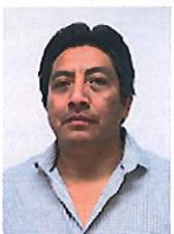
MTRO. CARLOS ALBERTO DZIB PECH

CONSEJERO ELECTORAL E INTEGRANTE DE LA COMISIÓN DE DENUNCIAS Y QUEJAS