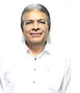
MTRO. ENRIQUE DE JESÚS UC IBARRA

CONSEJERO ELECTORAL E INTEGRANTE DE LA COMISIÓN DE DENUNCIAS Y QUEJAS