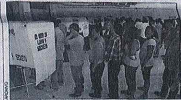
Ciudadanos de Mérida en espera de votar en pasadas elecciones

Desde el pasado 12 de diciembre, según el seguimiento semanal de Massive Caller, Renán Barrera ha mantenido y aumentado en las preferencias del voto. "Huacho" Díaz ha tenido altas y bajas semana con semana. Actual-