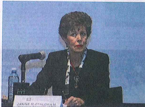
Janine Otálora Malassís, magistrada de la Sala Superior del Tribunal Electoral del Poder Judicial Federal

Este encuentro inició el pasado viernes y concluyó el sábado con el objetivo prin-