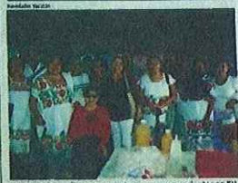
YUCATECOS pudieron reencontrarse con sus parientes en EU.

En contacto con la militancia ha compartido su visión de una Mérida ordenada, solidaria y sostenible trabajando en equipo, juntos para lograr cambios que contribuyan a la igualdad. El diálogo con integrantes de su partido le ha permitido reunir inquietudes y necesidades que servirán para enriquecer el trabajo por la ciudad.