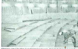
Obras en el teatro José Peón Contreras, donde hubo un incendio en 2022 y cuya fecha de reapertura aún se desconoce. El que en su día ya estaba listo, después de unas mejoras, es el Armando Manzanero.

Buen avance tienen los trabajos de rehabilitación del teatro Armando Manzanero que probablemente volverá a recibir al público.