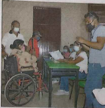
Un momento de la jornada electoral 2021. Una nueva encuesta revela cambios en las intenciones del voto rumbo a los comicios de 2024

PAN 41.9% Morena 34.7% PRI 7.4% PVEM 2.8% Otros 1.8% Aún no decide 11.4% De esta manera, en comparación con la anterior encuesta, el PAN avanzó 1 punto, Morena 1.1, PRI 1.1, PVEM